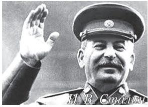
И. В. Сталин

Центральная Государственная Народная газета СССР. Сайт vladrus17.ru . Издаётся с 25 марта 2015 г.