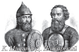
К. Минин и Д. Пожарский